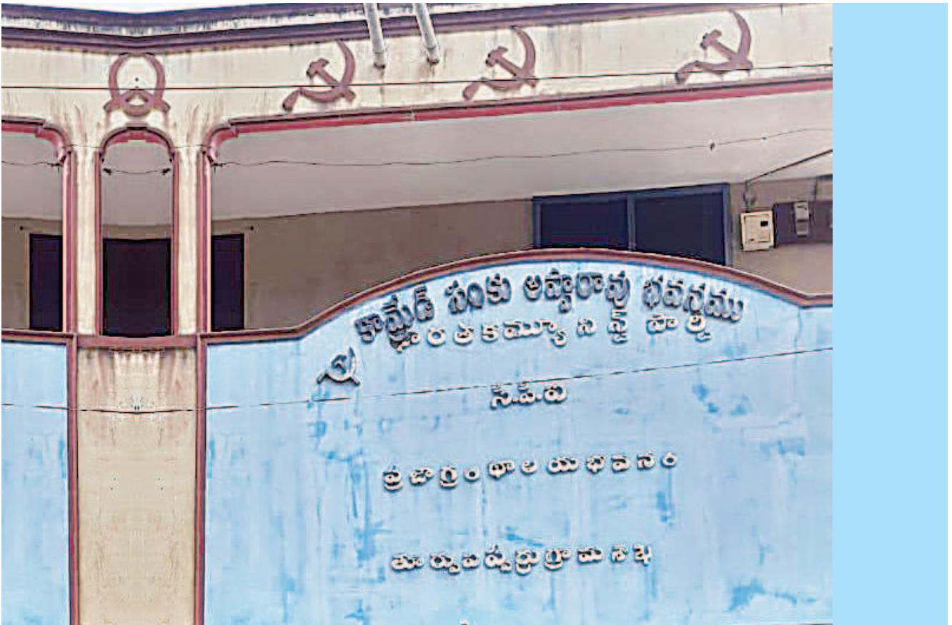
తూర్పు విప్రులో సంకు అప్పారావు భవనం.. సీపీఐ కార్యాలయం