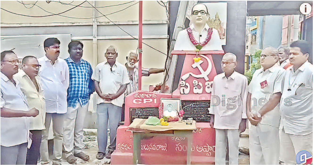
ఏలూరులో సంకు అప్పారావు విగ్రహం.. నివాళులర్పిస్తున్న సీపీఐ నాయకులు